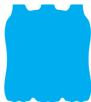
Imballaggi in plastica