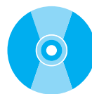
CD e DVD