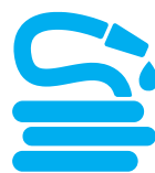
Tubi elettrici, idraulici e per l'irrigazione