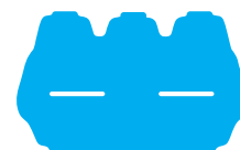
Vaschette uova vuote