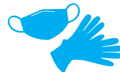
Mascherine e guanti monouso