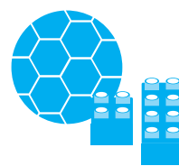
Giocattoli e palloni