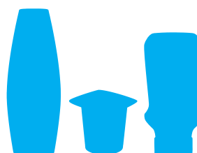
Flaconi shampoo, flaconi salse e barattoli yogurt