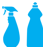
Flaconi detersivo e nebulizzatori