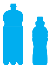
Bottiglie di plastica e film esterno