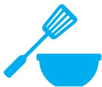
Utensili da cucina in plastica o silicone