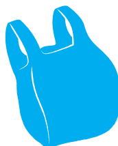
Sacchetti in plastica