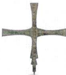
Figura 1 Croce di Ibligo-Invillino. Museo Archeologico di Cividale del Friuli (prima metà dell'VIII secolo, da COSTANTINO 313 d.C., cat. 203).

Della tomba, rinvenuta priva di resti antropici, restano tre lati, decorati ciascuno da una croce di colore rosso con bracci di uguale lunghezza, patenti, ovvero che si allargano allontanandosi dal centro. Croci di questa tipologia sono molto frequenti nel corso del Medioevo: se ne rintracciano esemplari anche in oreficeria, come ad esempio le croci processionali di Ibligo-Invillino e Santa Maria in Valle (rispettivamente datate alla prima metà e seconda metà dell'VIII secolo, figg. 1-2) o in ambito scultoreo, come una lastra frammentaria con croce greca patente (nella variante gemmata) da Albenga datata all'VIII d.C. (fig. 3), o una lastra con croce a bracci patenti iscritta, inserita nella muratura di una parrocchiale dell'Oltrepò pavese e datata genericamente ad epoca romanica (fig. 4).