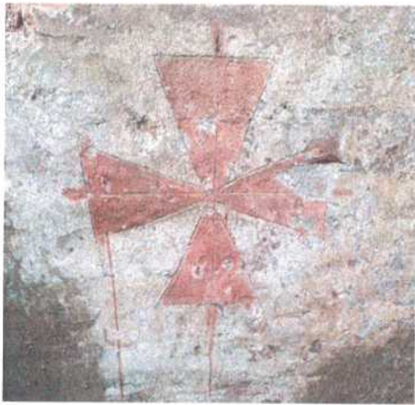
Figura 5 Cremona, Largo Boccaccino. Una delle croci dipinte nella sepoltura.

Quanto al primo punto, è necessario in estrema sintesi considerare i mutamenti nell'ambito del repertorio decorativo e della sintassi compositiva che interessano questa categoria di manufatti dall'età paleocristiana al Medioevo: gli studi pubblicati dalla Fiorio Tedone negli anni Ottanta hanno messo in evidenza come la