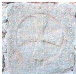
Figura 4 Borgoratto Mormorolo (Pv). Lastra con croce iscritta (et  romanica). LUSUARDI SIENA 2006.

In attesa che siano completate le operazioni di documentazione e di restituzione della sequenza stratigrafica del contesto, che potr  fornire qualche utile indizio cronologico, dovendo fare affidamento esclusivamente sulla decorazione come unico indicatore di riferimento, si possono preliminarmente avanzare alcune considerazioni che riguardano il tipo di decorazione e la morfologia della croce dipinta.