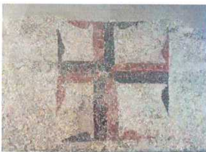
Figura 9 Milano, Castello Sforzesco. Testata dipinta con croce bicroma dall'area del complesso episcopale (tomba di Maginfredus, X - XI sec.).

Altri dettagli interessanti, su cui ci si potrà soffermare con maggiore attenzione dopo l'analisi dei pigmenti, sono la presenza di colature e di "protrusioni" rosse al centro di ogni terminazione.