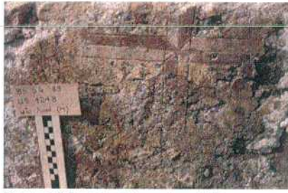
Figura 10 Brescia, Monastero di San Salvatore Santa Giulia. Croce bicroma dipinta con incisioni preparatorie (BROGIOLO – MORANDINI 2014).

Infine, le cosiddette “protrusioni”, poste in corrispondenza di ogni braccio, richiamano gli elementi floreali o vegetali che caratterizzano le croci “fiorite”, ovvero croci dalle quali germoglia la vita, rappresentata in modo più o meno stilizzato da elementi vegetali. In questo caso in particolare, queste piccole escrescenze rosse potrebbero essere l’esito di un processo di semplificazione estrema di questi dettagli vegetali di solito collocati appunto in corrispondenza delle terminazioni dei bracci (fig. 11).