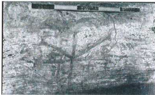
Figura 8 Cesano Boscone (Mi). Croce dipinta all'interno di una sepoltura (CERESA MORI - RIGHETTO 2001).

Nel caso della tomba di Cremona, la presenza di queste incisioni in una croce che in realtà è monocroma, potrebbe indicare un legame, forse non solo cronologico, con una tipologia di croce che tra il IX e l'XI secolo conosce una larga diffusione negli ambienti dell'alto clero milanese e in ambito benedettino.