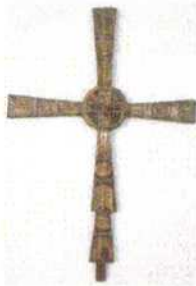
Figura 2 Croce di Santa Maria in Valle. Museo Archeologico di Cividale del Friuli (seconda metà dell'VIII secolo, da COSTANTINO 313 cat. 204).