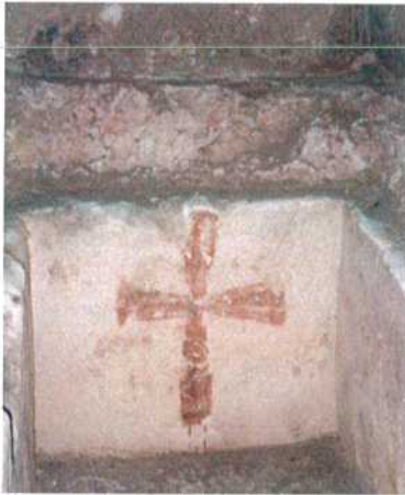
Figura 7 Otranto (Le), Cattedrale. Testata della sepoltura dipinta con arcosolio databile al XI - XII sec. (STRAFFELLA 2007).

In generale, nei casi in cui è stato possibile accertarlo grazie all'esame autoptico o per la presenza di documentazione fotografica a colori, le tonalità del rosso sono quelle maggiormente attestate, perché richiamano il colore del sangue, quindi della passione di Cristo. Il bruno è presente nelle croci cosiddette "bicrome", quando è ritenuto utile a creare un efficace contrasto cromatico con il rosso (fig. 9).