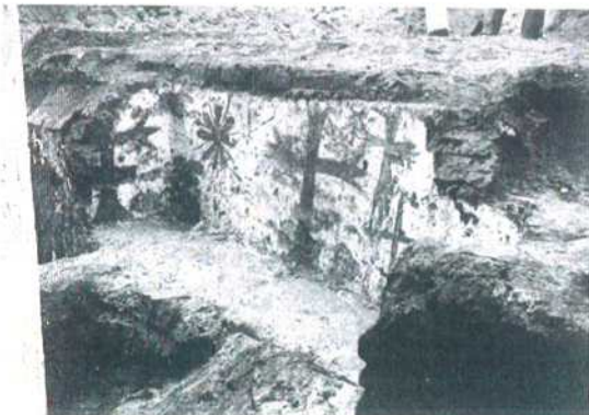
Figura 6 Milano, san Giovanni in Conca. Sepoltura con croci dipinte databile al basso Medioevo (FIORIO TEDONE 1986).

Nella sepoltura rinvenuta a Cremona, proprio l'estrema semplicità del repertorio decorativo orienta ad un arco cronologico successivo al IX-X secolo.