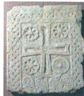
Figura 3 Albenga. Lastra frammentaria con croce, sec. VIII. Albenga Museo Diocesano (MARCENARO 2003).