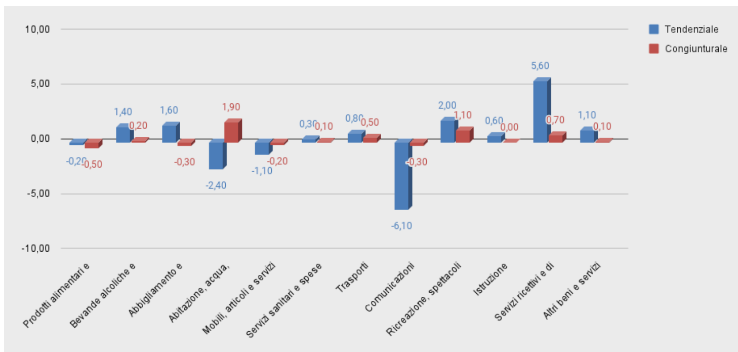
Figura 1.: Divisioni - variazioni tendenziali e congiunturali per il mese di Luglio

Nel grafico che segue, è riportato l'andamento del tasso di variazione (sia tendenziale che congiunturale) relativo alle Divisioni.