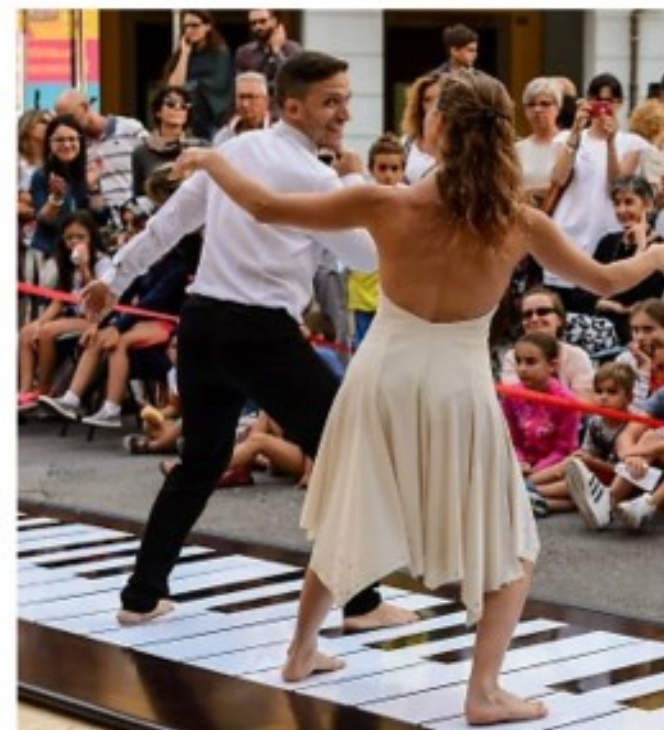
Realizzazione evento "Suonami"