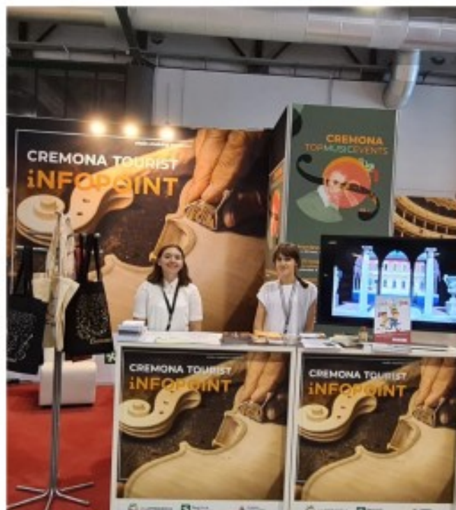
Partecipazione Cremona Musica