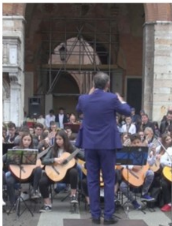
Sostegno International Spring Music Festival