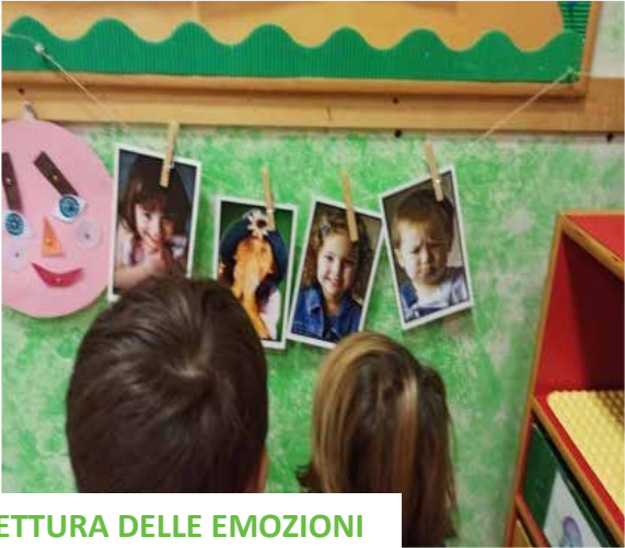
LETTURA DELLE EMOZIONI