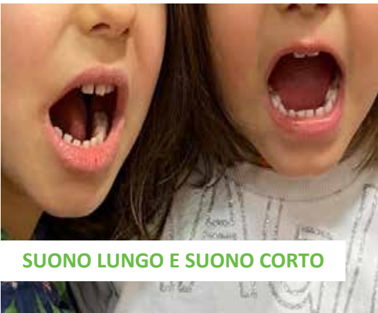
SUONO LUNGO E SUONO CORTO