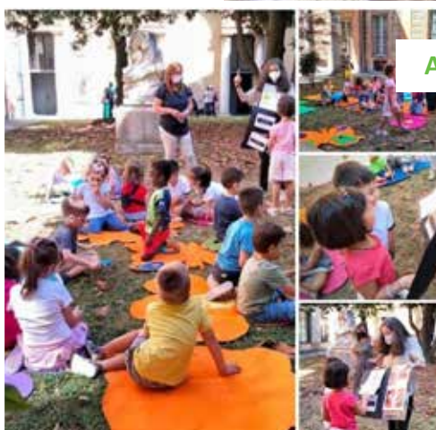
AL MUSEO DI STORIA NATURALE