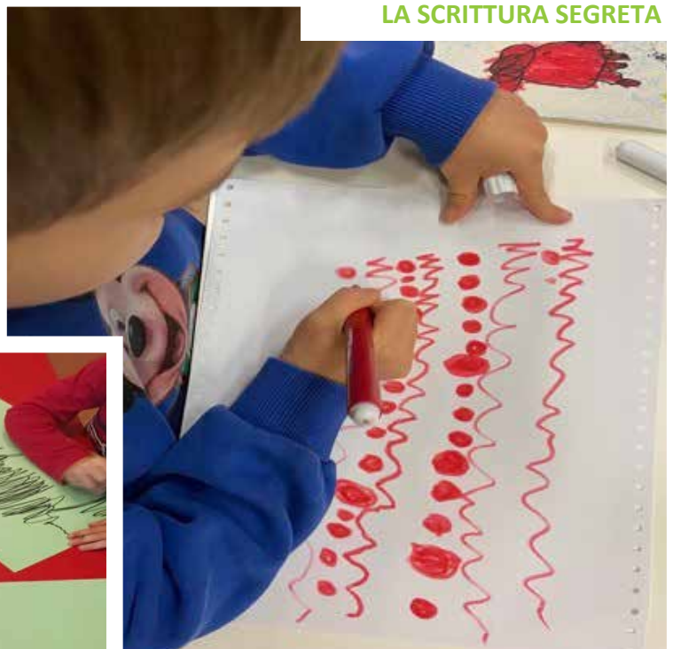
LA SCRITTURA SEGRETA