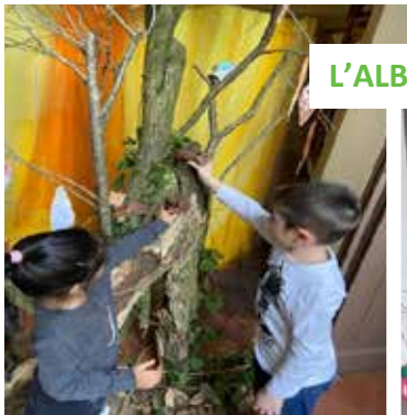
L'ALBERO DEI DIRITTI DEI BAMBINI