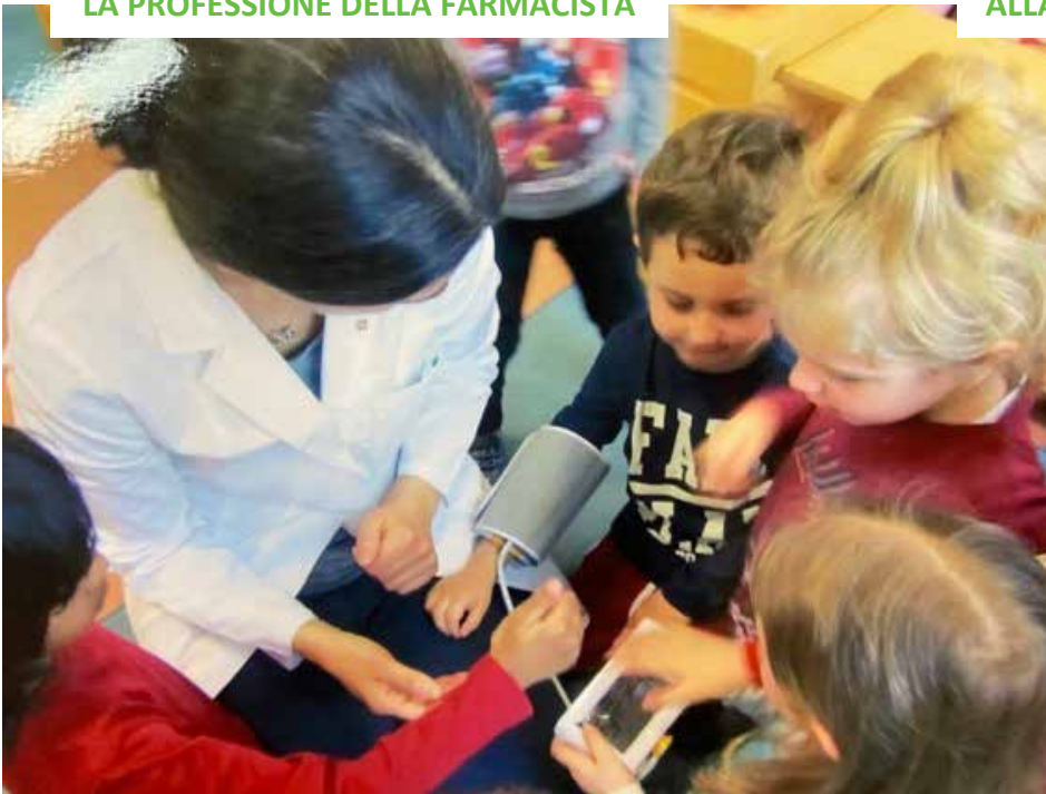
LA PROFESSIONE DELLA FARMACISTA