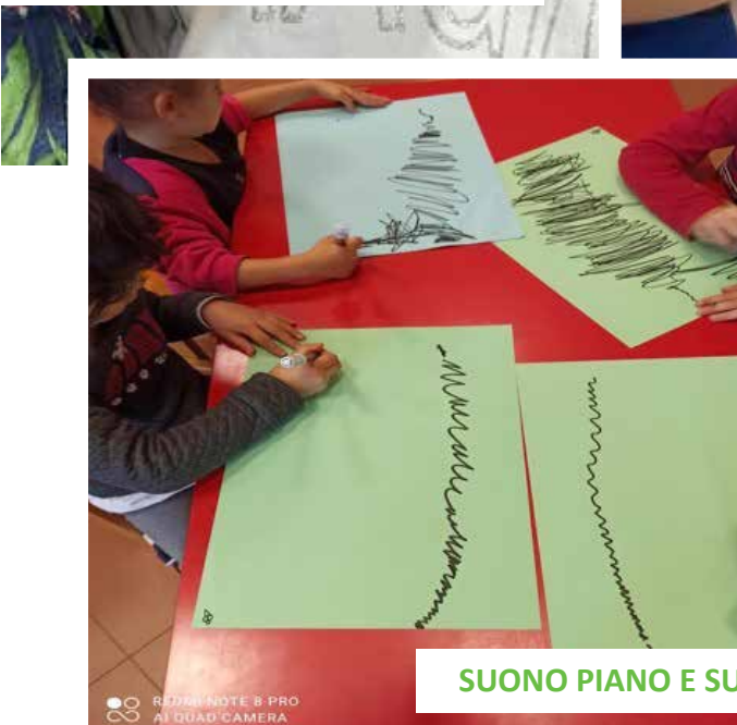
SUONO PIANO E SUONO FORTE