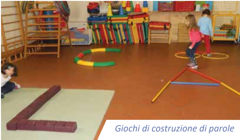
Giochi di costruzione di parole