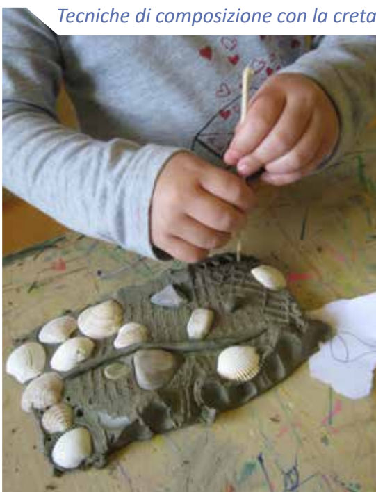
Tecniche di composizione con la creta