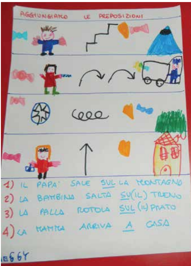
Composizione di frasi con immagini del soggetto, del predicato verbale e di altri complementi