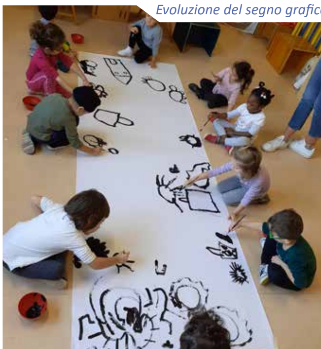
Evoluzione del segno grafico