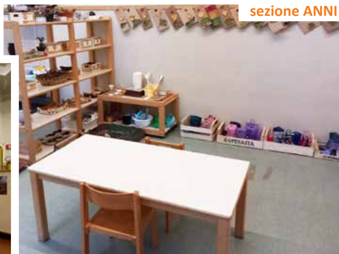
sezione ANNI 4