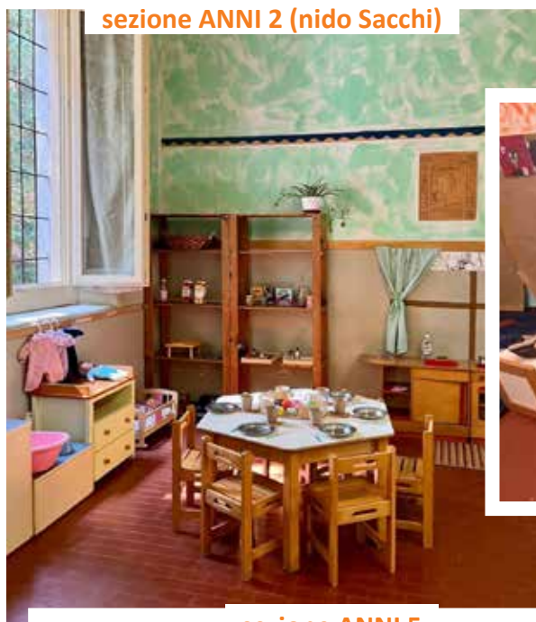
sezione ANNI 2 (nido Sacchi)

Le sezioni, tutte ampie e divise in contesti di apprendimento, racchiudono punti diversi di gioco, dispongono di un atelier, utilizzato come laboratorio creativo e di espressione artistica e di un bagno per i bambini, mentre sala da pranzo e palestra sono spazi comuni.