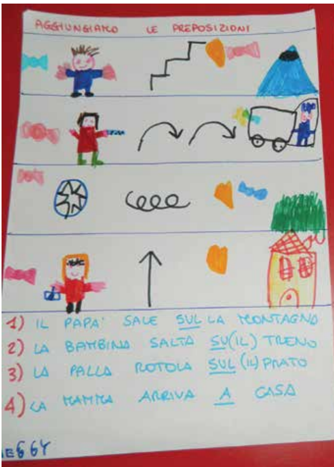
Composizione di frasi con immagini del soggetto, del predicato verbale e di altri complementi