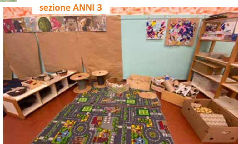
sezione ANNI 3