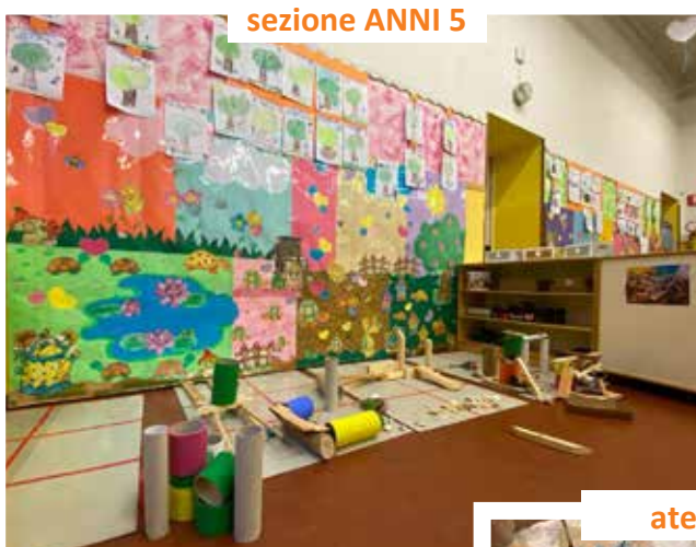
sezione ANNI 5