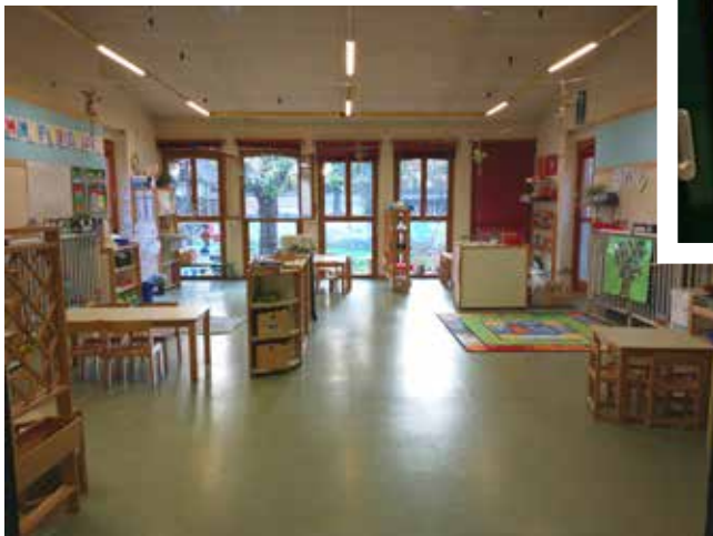
sezione ANNI 5