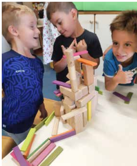
L'ANGOLO DELLE COSTRUZIONI: esprimo la mia fantasia

Questo angolo rappresenta anche un luogo di condivisione e scambio , un posto dove chiacchierare e raccontarci rielaborando i vissuti personali.