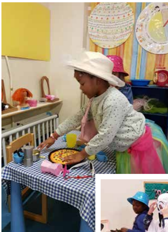
L'ANGOLO SIMBOLICO: gioco del far finta di...