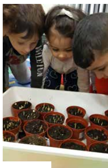
Prime attività di orticoltura e semina.