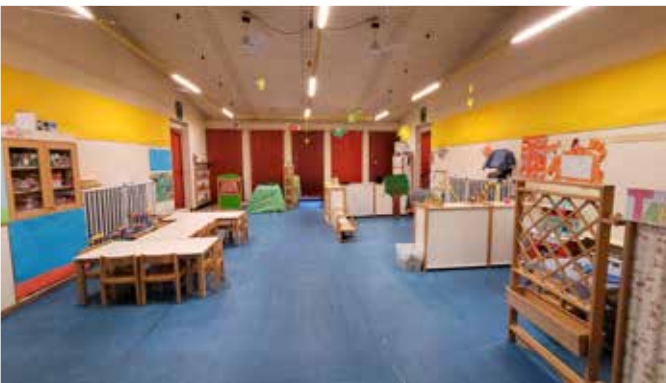
sezione ANNI 3

La sezione è il primo luogo che il bambino conosce all'interno della scuola: è organizzata e attrezzata in modo da garantirgli esperienze che favoriscono la sua crescita personale, sociale e le sue competenze, oltre ad essere utilizzata per il riposo pomeridiano.