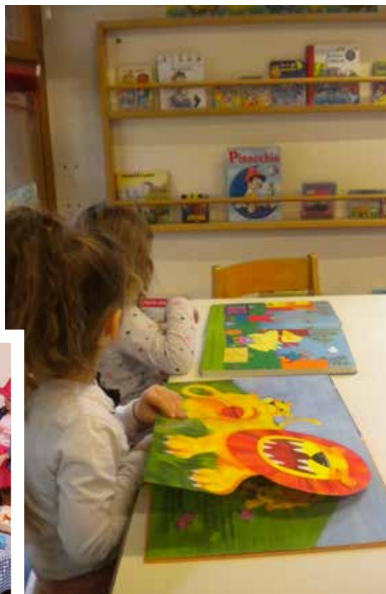
L'ANGOLO MORBIDO/LETTURA: sfogliando s' impara