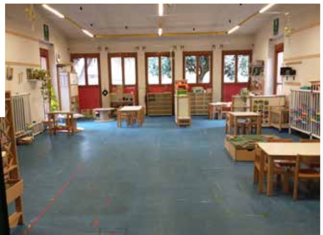
sezione ANNI 4