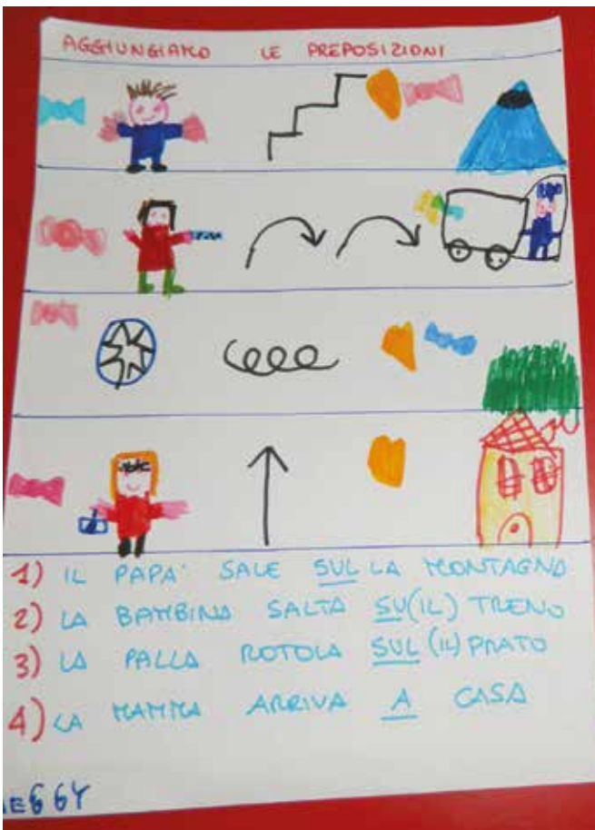
Composizione di frasi con immagini del soggetto, del predicato verbale e di altri complementi