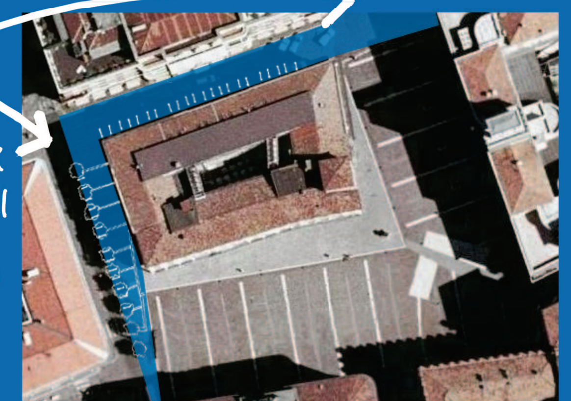
16. SPAZI DI SOSTA PER CICLI E MOTOCICLI

VENGONO AUMENTATI GLI SPAZI DI SOSTA PER CICLI NELLA VIA GRAMSCI E VIA CAPITANO DEL POPOLO REJE PEDONALI