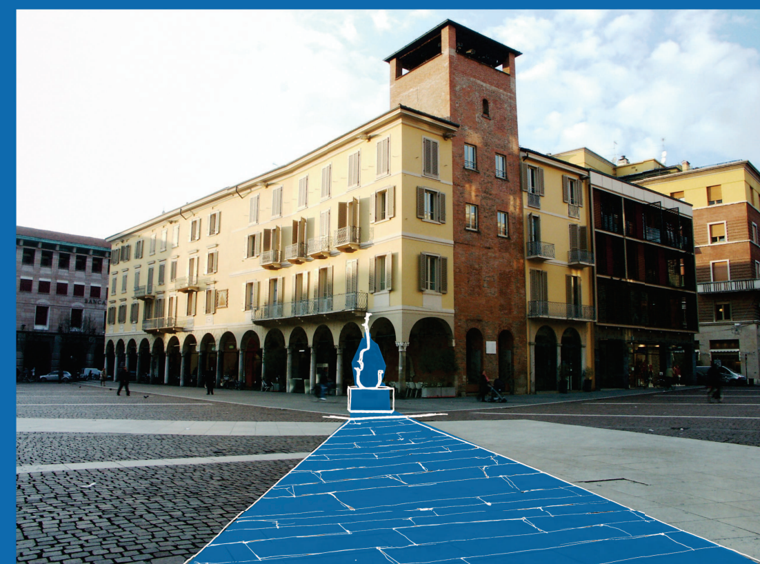
2. RIPOSIZIONAMENTO STATUA DI STRADIVARI

SPOSTAMENTO STATUA E SOSTITUZIONE CON OPERA VINCITRICE 'CONCORSO ANNUALE DI ARTE CONTEMPORANEA' - vedere punto 15-