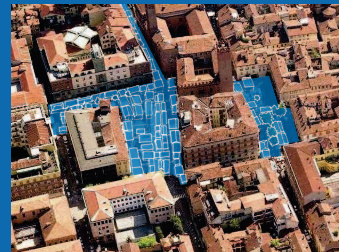
3. MULTIFUNZIONALITA' E FLESSIBILITA' SPAZIO/TEMPORALE

LO STATO ATTUALE DELLA PIAZZA GIA' SODDISFA OGNI ESIGENZA D'USO SPAZIO-TEMPORALE