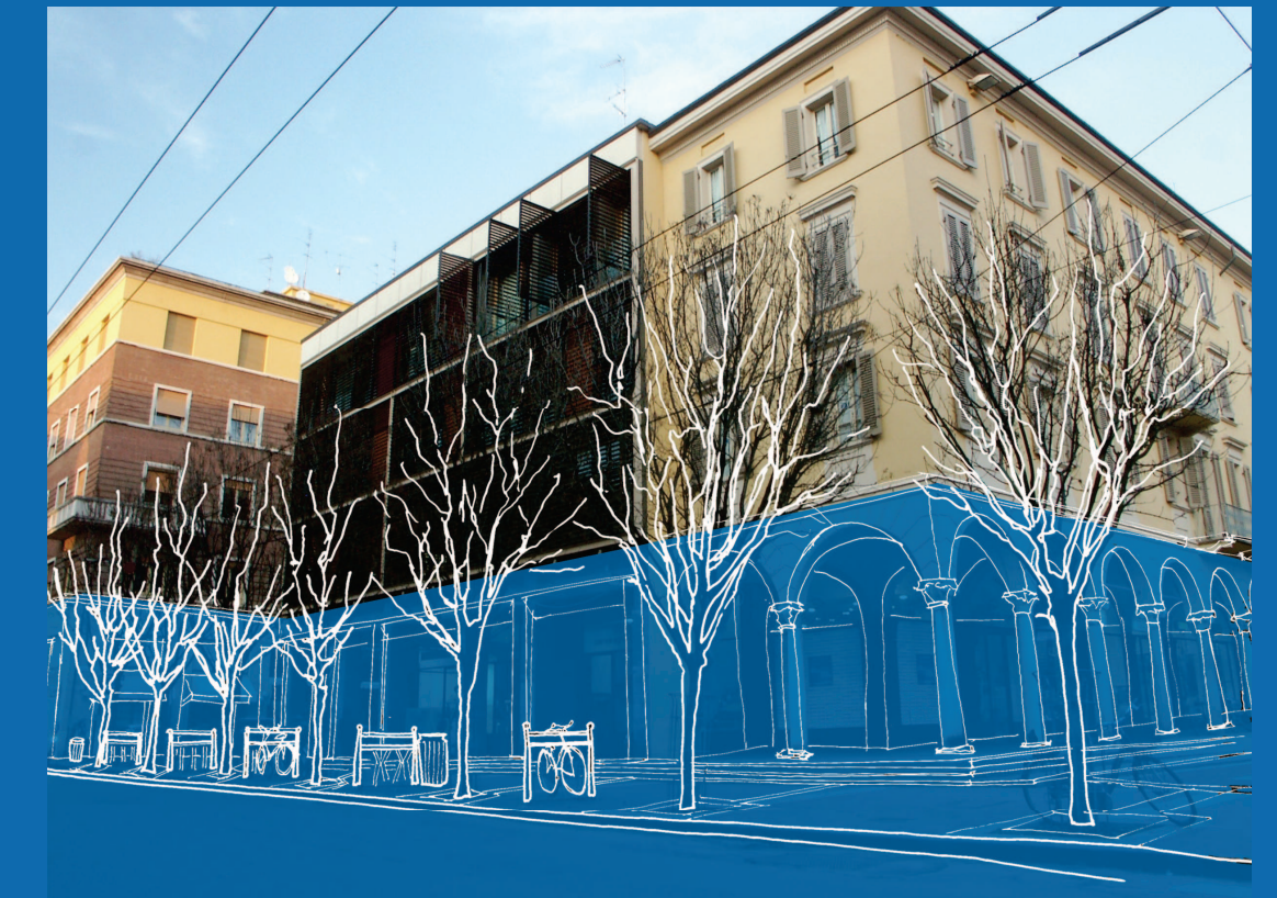
4. ARREDO URBANO