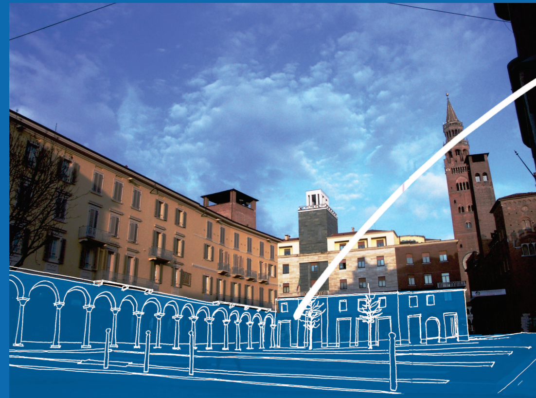
1. ELIMINAZIONE PENSILINA

LA RIMOZIONE DELLA PENSILINA E' GIA' STATA ESEGUITA