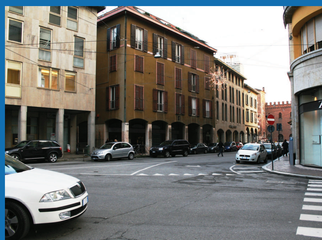
COLLEGAMENTO TRA LE PIAZZE