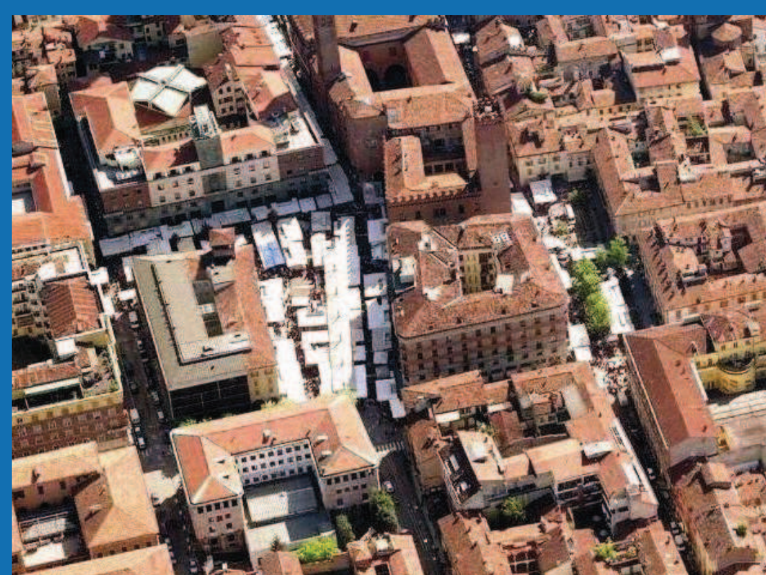
MULTIFUNZIONALITA' E FLESSIBILITA'