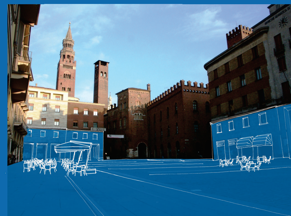
12. RAZIONALIZZAZIONE PLATEATICI

E' POSSIBILE SCEGLIERE LIBERAMENTE NUOVE DISPOSIZIONI DEI PLATEATICI