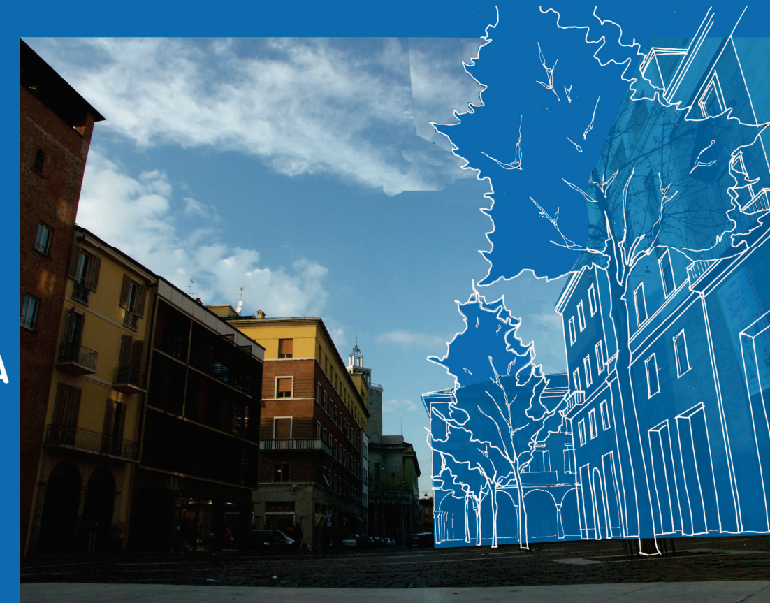
6. SISTEMA DEL VERDE - SOSTENIBILITA' AMBIENTALE

L'AUMENTO E LA MODIFICA DEL SISTEMA A VERDE SONO IN CONTRASTO CON LA POLIFUNZIONALITA' DELLA PIAZZA